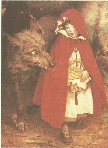
Jessie Willcox Smith, 1919

hora de caminhada da aldeia. Mal pisara na floresta, Chapeuzinho Vermelho topou com o lobo. Como não tinha a menor ideia do animal malvado que ele era, não teve um pingão de medo.