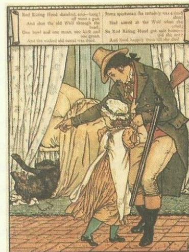
Walter Crane, 1875

Chapeuzinho Vermelho, sua avó e o caçador ficaram radiantes. O caçador esfolou o lobo e levou a pele para casa. A avó comeu os bolinhos, tomou o vinho que a neta lhe levava, e recuperou a saúde. Chapeuzinho Vermelho disse consigo: “Nunca se desvie do caminho e nunca entre na mata quando sua mãe proibir.”