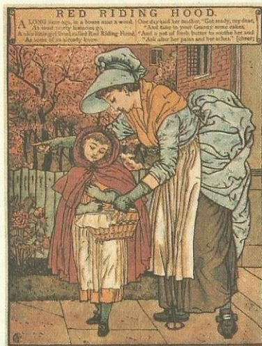
Walter Crane, 1875

Um dia, a mãe da menina lhe disse: “Chapeuzinho Vermelho, aqui estão alguns bolinhos e uma garrafa de vinho. Leve-os para sua avó. Ela está doente, sentindo-se fraquinha, e estas coisas vão revigorá-la. Trate de sair agora mesmo, antes que o sol fique quente demais, e quando estiver na floresta