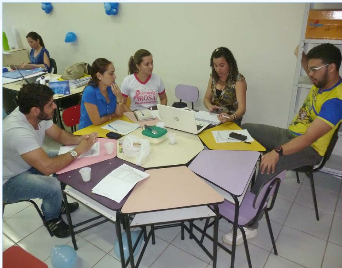
Reunião para as ações do PSE