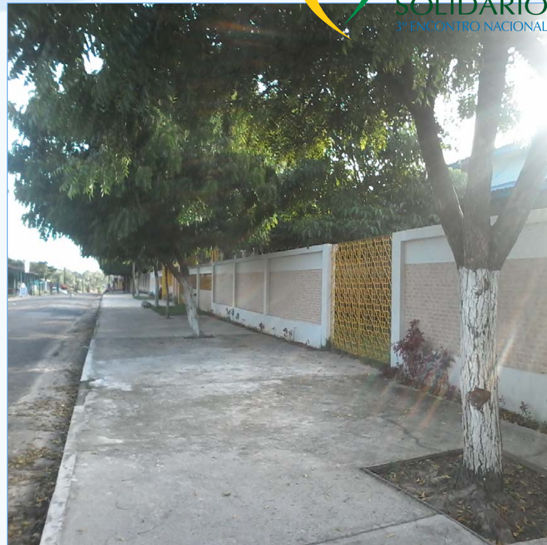
Frutos do IBS