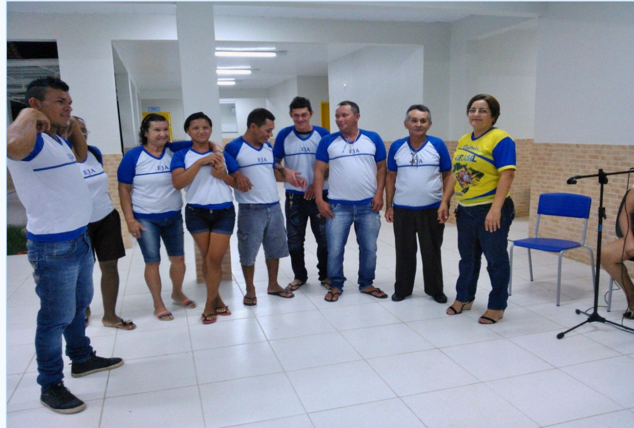
Alunos da EJA no pátio da escola Manoel Antônio Leite