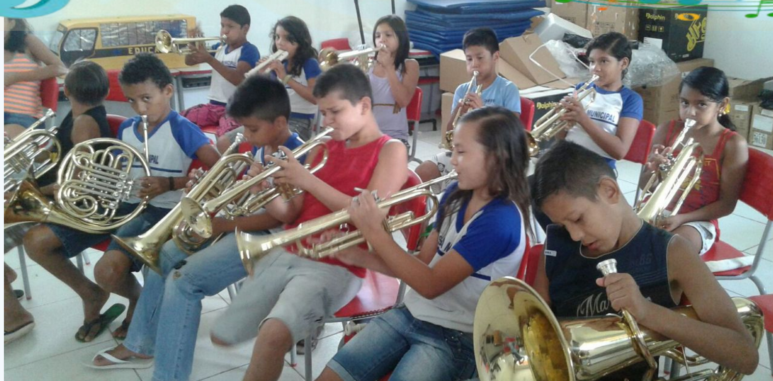
Alunos da turma de música em atividade na Escola Manoel Antônio Leite