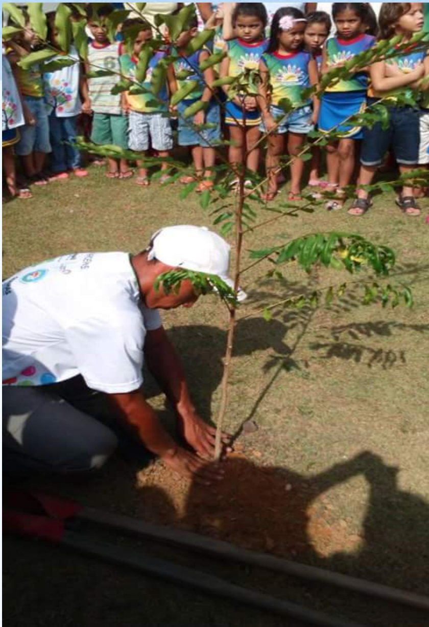
Aula de campo com alunos da escola Ana Pinheiro