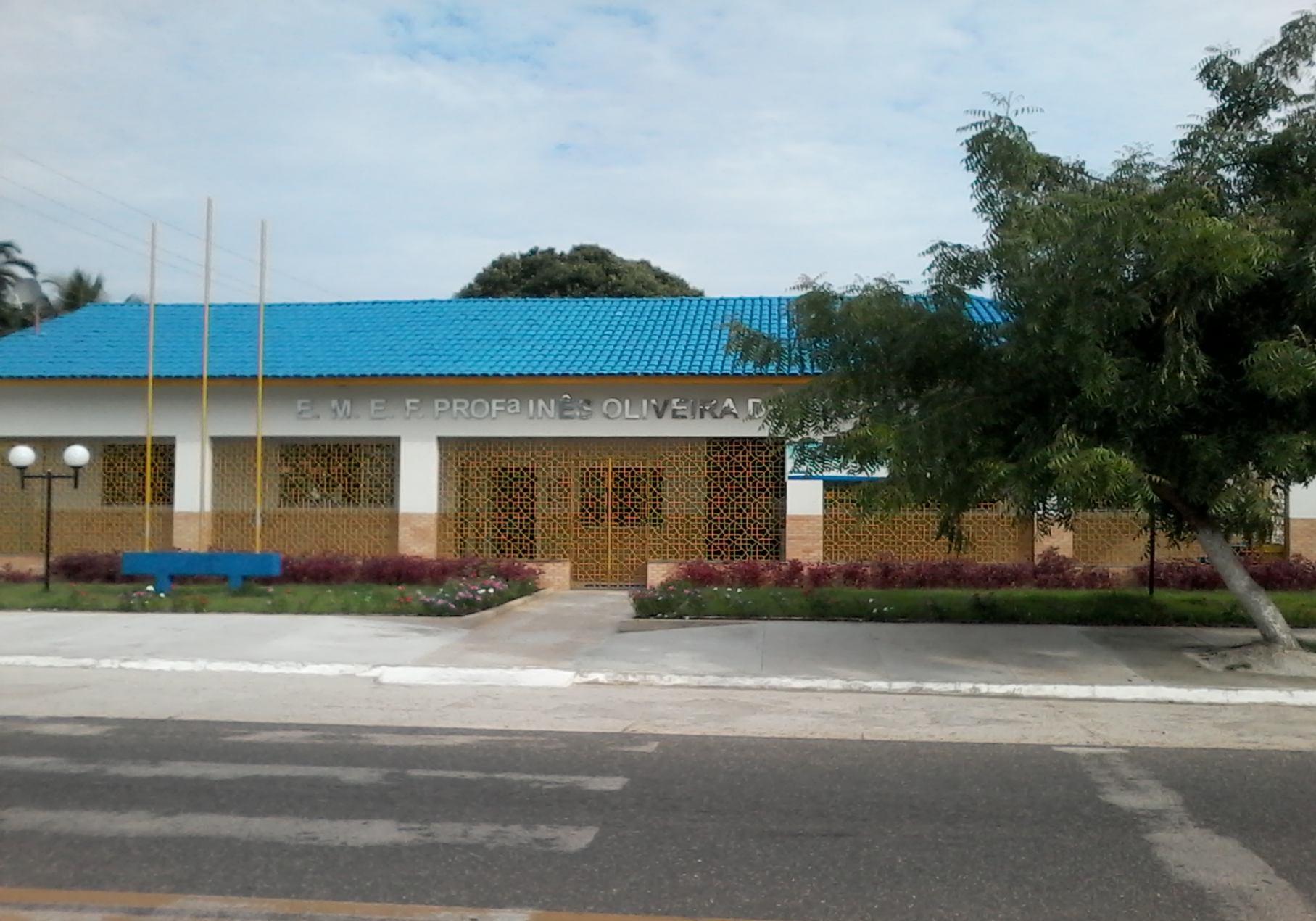
Escola Piloto de Educação em Tempo Integral Professora Inês Oliveira de Mesquita