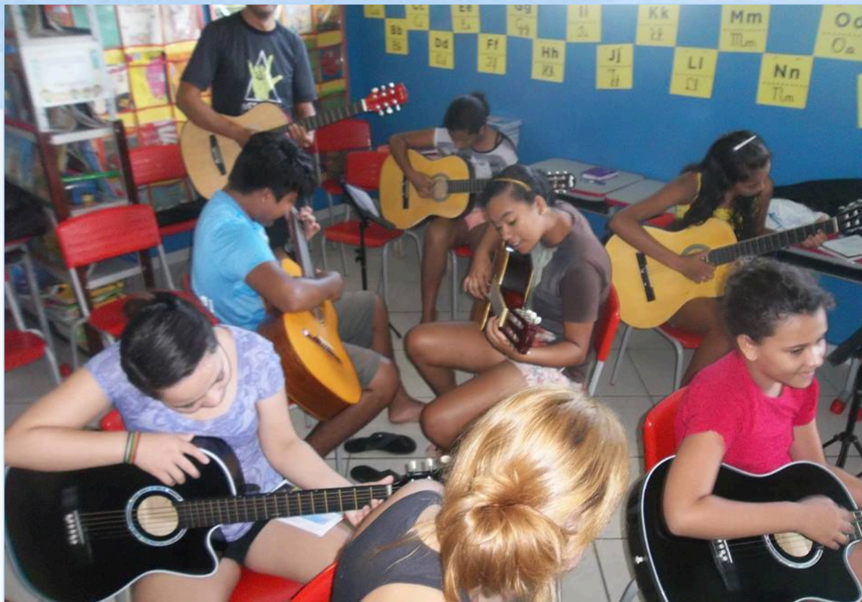
Aula de violão na Escola José Alves Leite, iniciativa da Gestão e voluntários