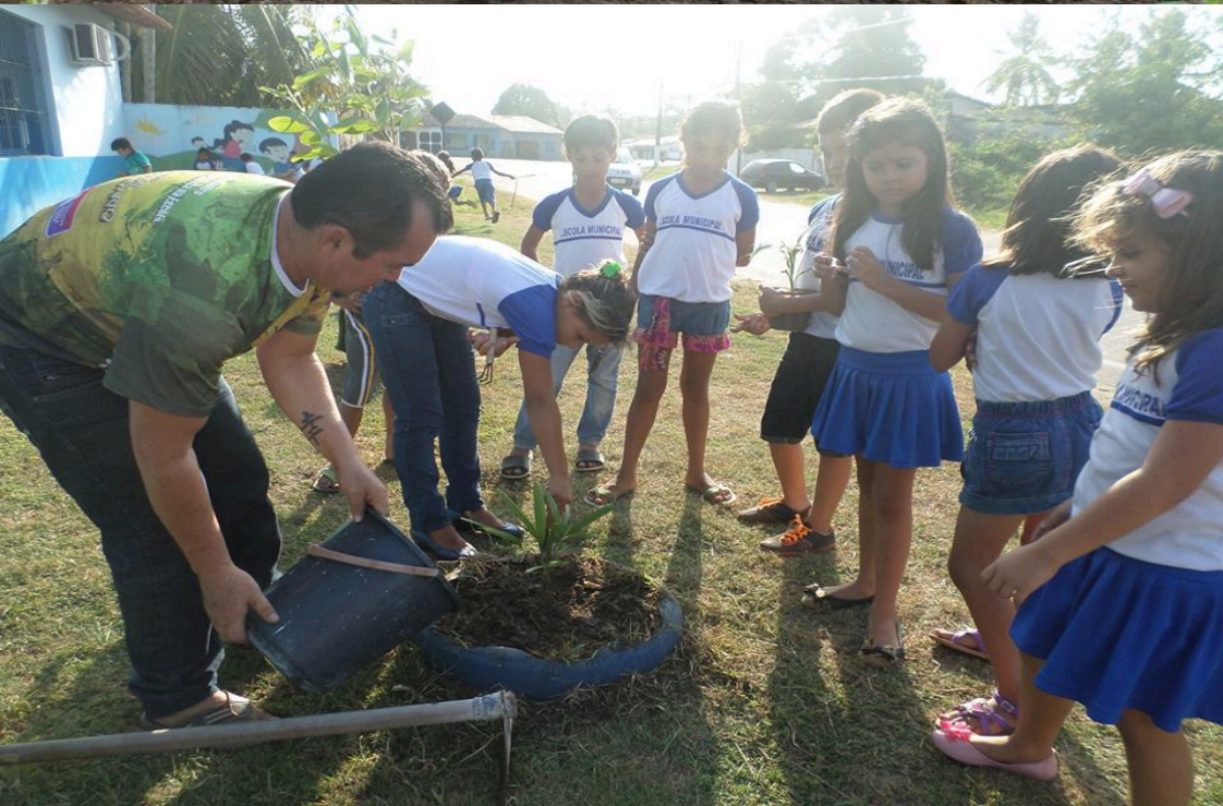
Jardim na escola