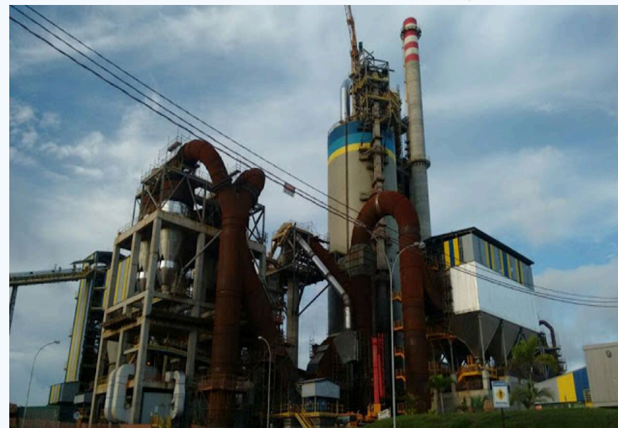
Fábrica de Cimentos-Unidade Primavera-PA

Diretores, equipe técnica e formadores do PVE