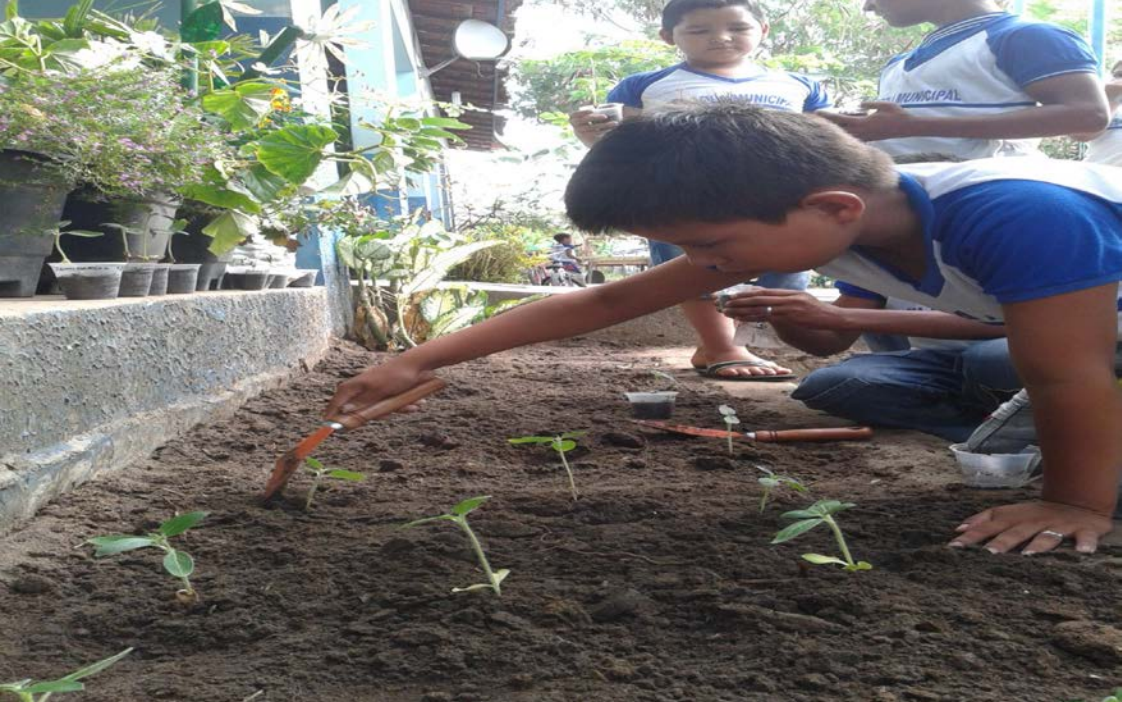
Alunos plantando girassóis