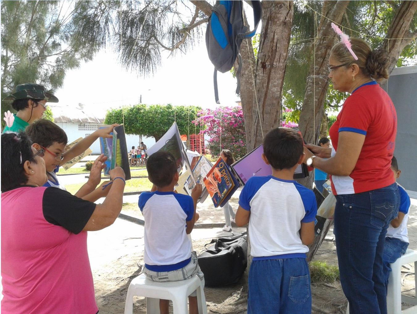
Atividade na Praça Ruth Passarinho

*Ação adotada pela Biblioteca Municipal em parceria com as escolas.