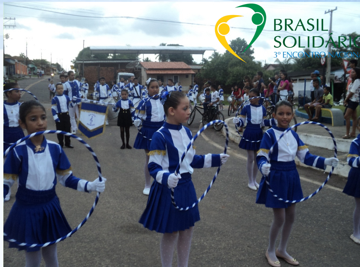
Banda Marcial preparando-se para sua apresentação