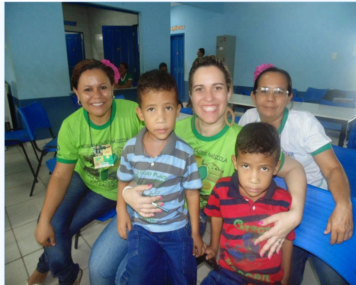
Profissionais da saúde na escola