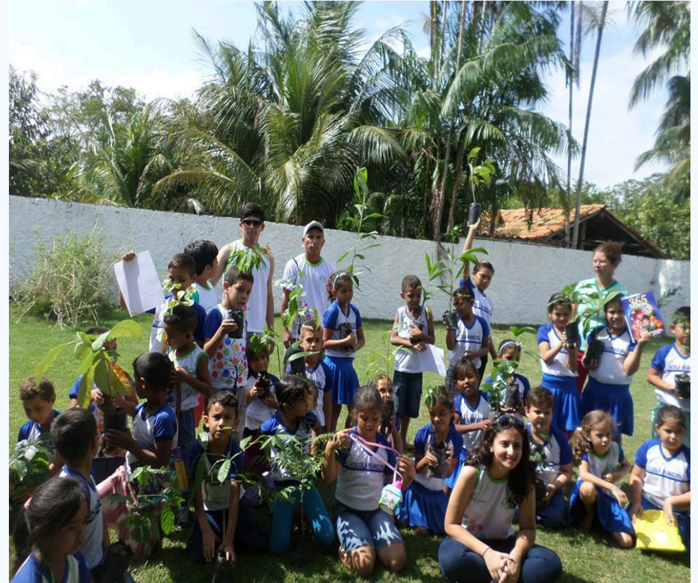
Aula de campo com alunos da escola Alves Leite