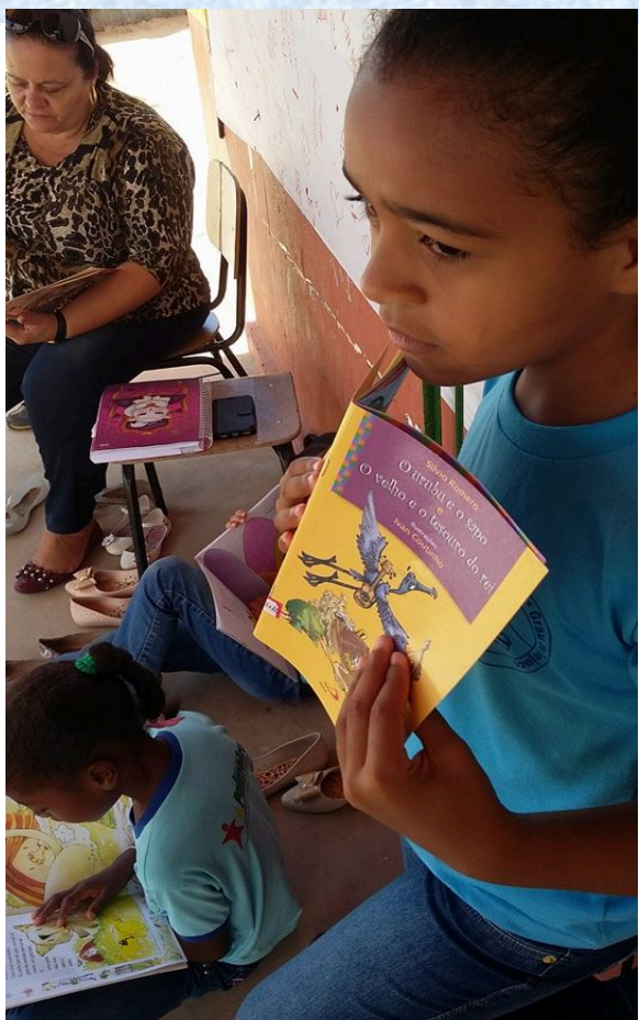
IV Conferência de Cultura