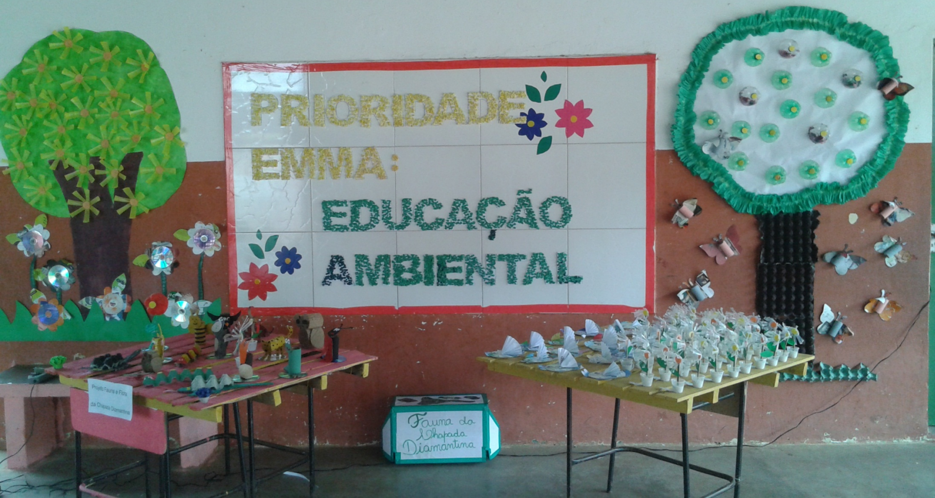
Exposição do Projeto Fauna e Flora