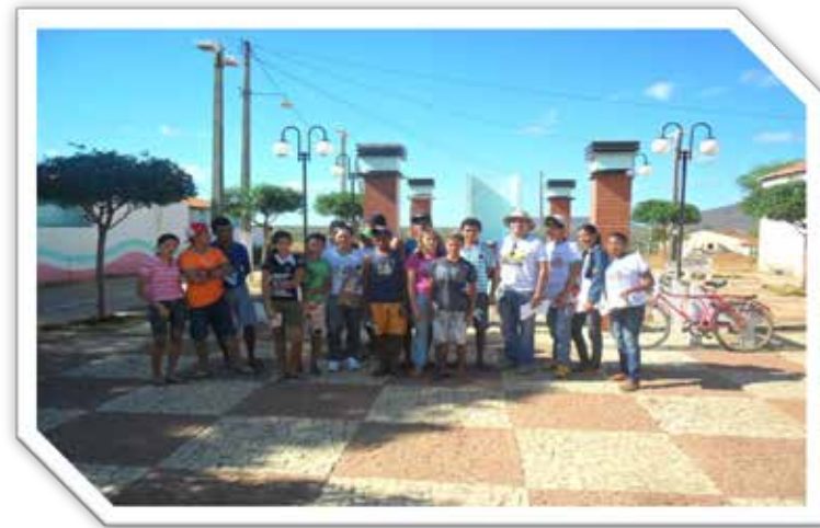
Mobilização nas comunidades