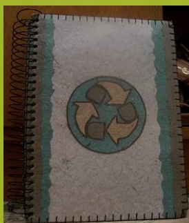
Encadernação de cadernos