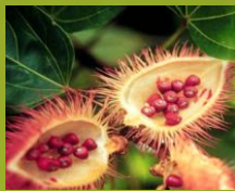
Sementes de Urucum.

Para colorir seu papel utilize sementes de urucum.