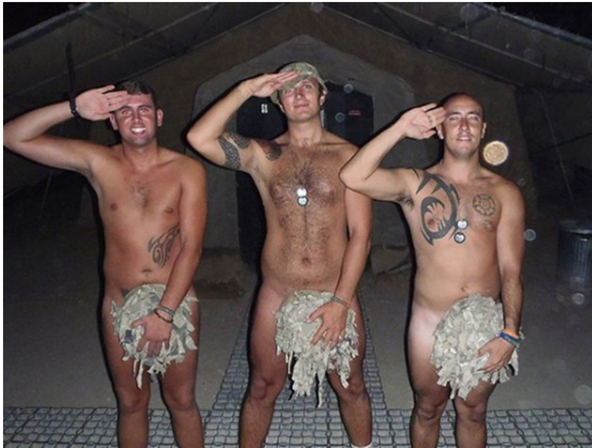
Caso príncipe Harry, 2012