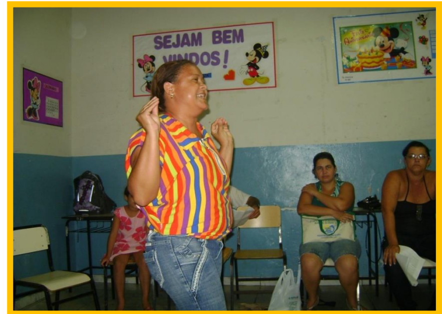
Professora fazendo contação de história em Jaíba, MG ( Abril/2010)

Contar história é uma arte, e para isso qualquer um de nós pode trabalhar e desenvolver algumas qualidades que fazem toda diferença na narrativa.