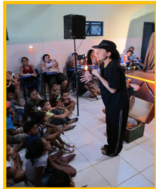
Contação de história em Novo Acordo/TO (Agosto/2011)