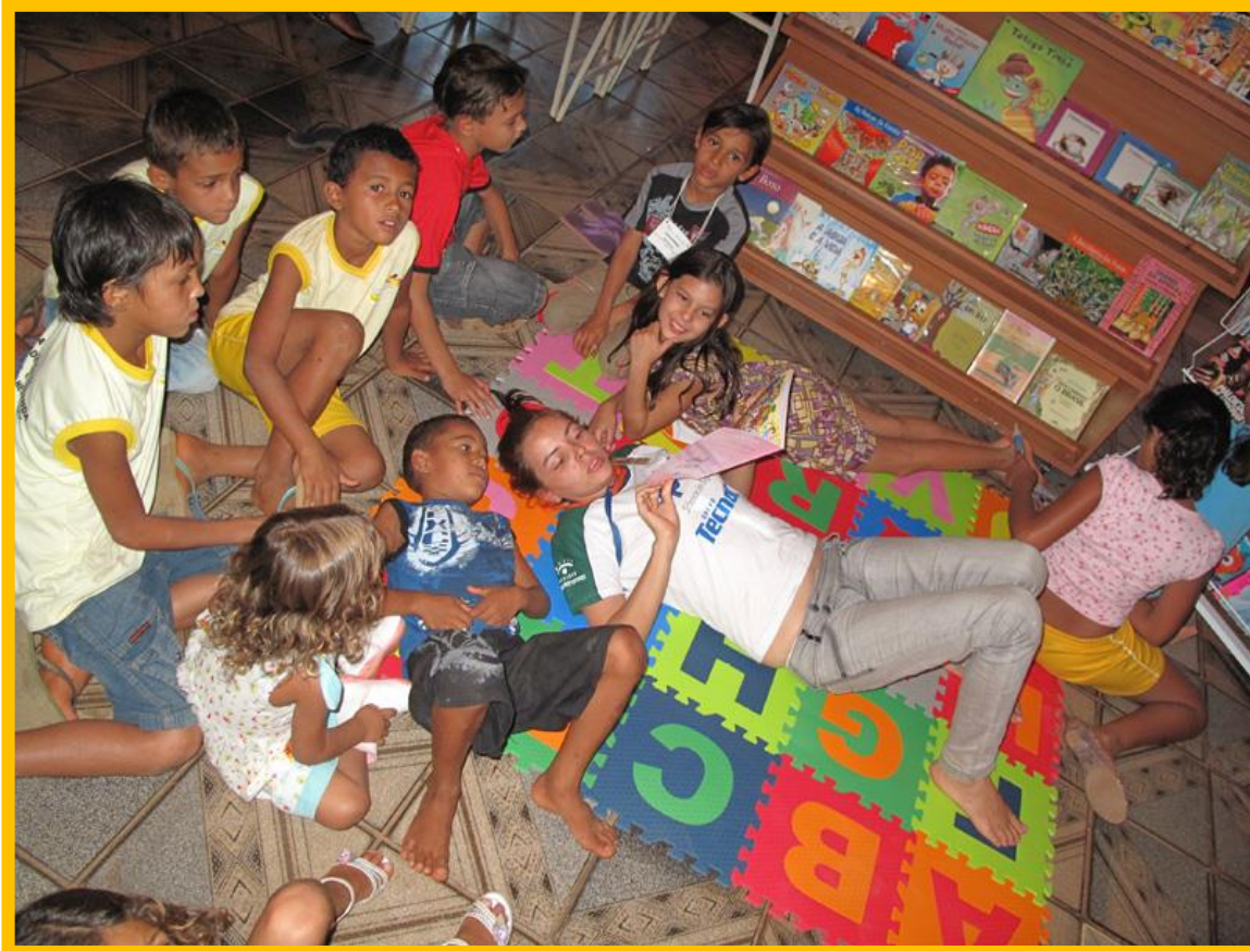
Momento de leitura com crianças em Aparecida do Rio Negro, TO. (Agosto/2010)