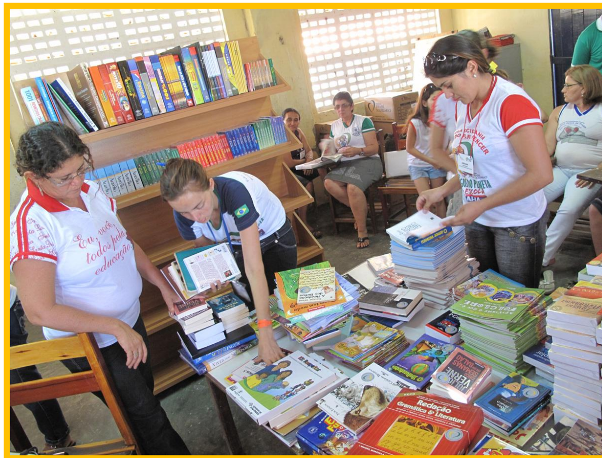
Montagem de Biblioteca Escolar em Crateús, CE. - (Agosto/2010)