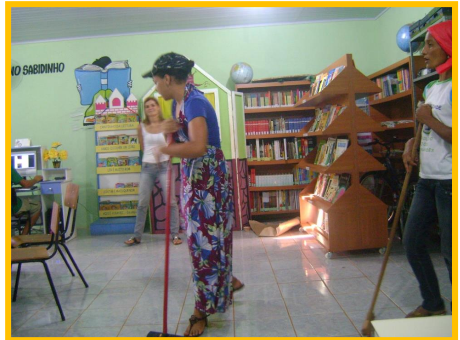
Contação de história em Iraquara, BA (Abril/2010)