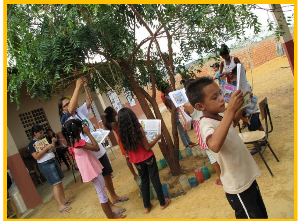
Projeto Amigos do Planeta na Escola/2010 – São Raimundo Nonato, PI