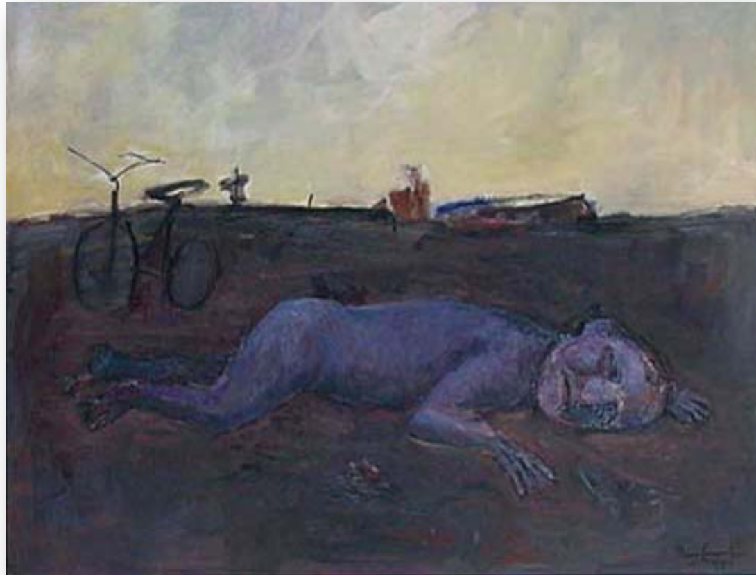
Arte Contemporânea - Iberê Camargo