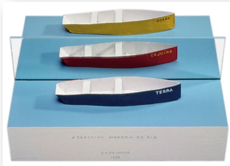
Arte Contemporânea - Guto Lacaz