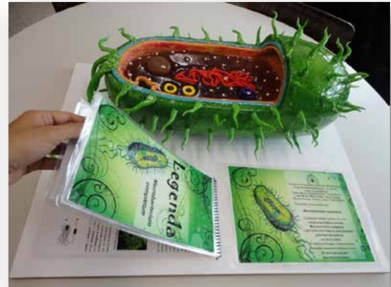
Trabalho biologia / feira de ciências