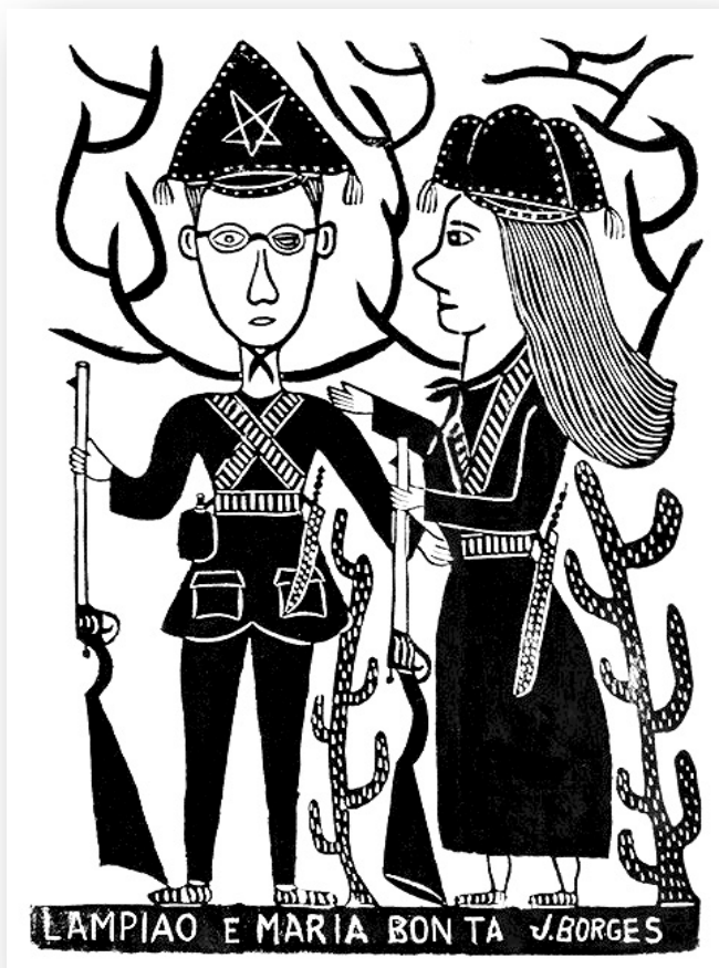
Arte Popular - J. Borges