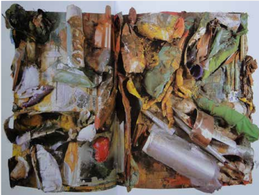
Arte Contemporânea - Nuno Ramos